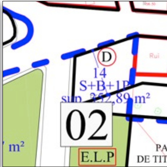
Profundidad edificable con la MP

La MP propone la modificación de la superficie de la ocupación de la profundidad edificable que contempla la normativa vigente en el emplazamiento c/Pou Nou, esquina a calle sin nombre, lindante a espacio libre público, de forma que tenga la adecuada coherencia.